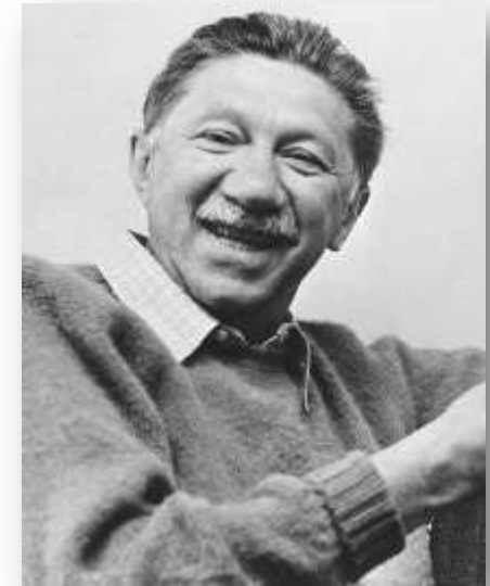
Abraham Harold Maslow psicologo